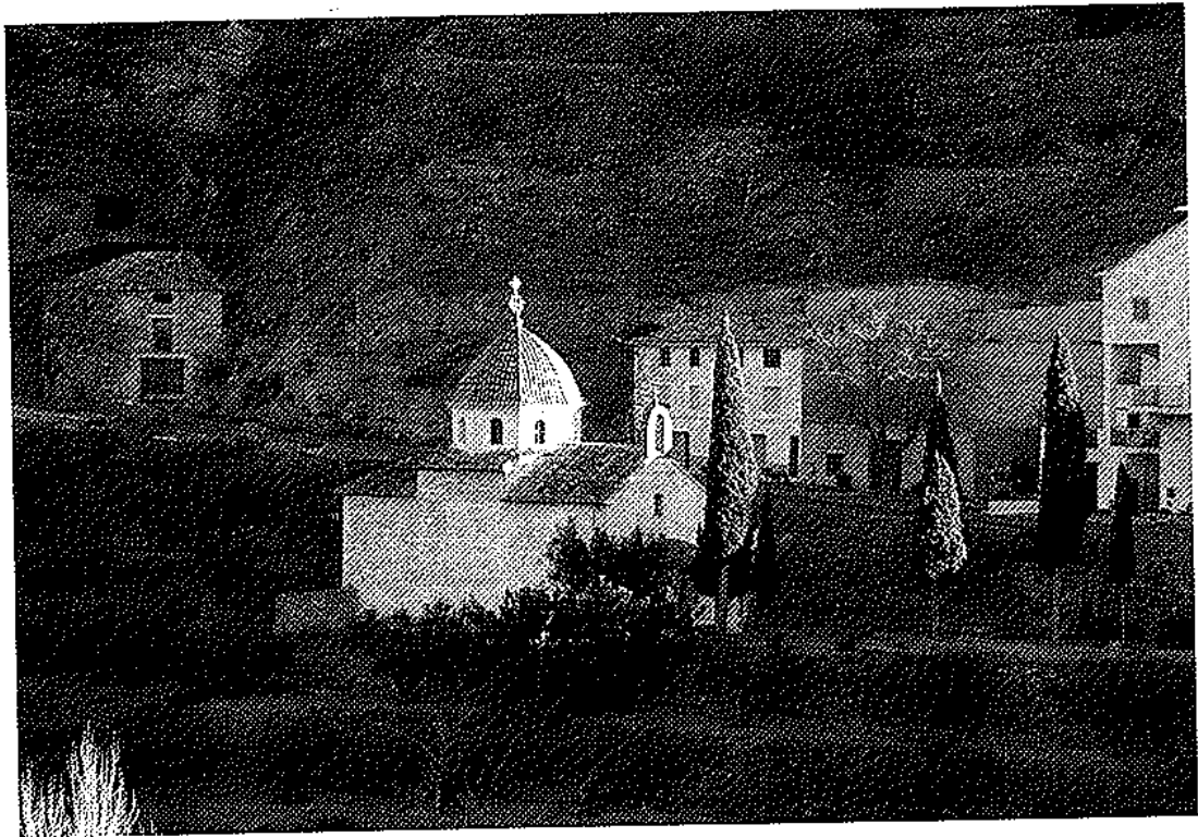
Ermita del Pilar