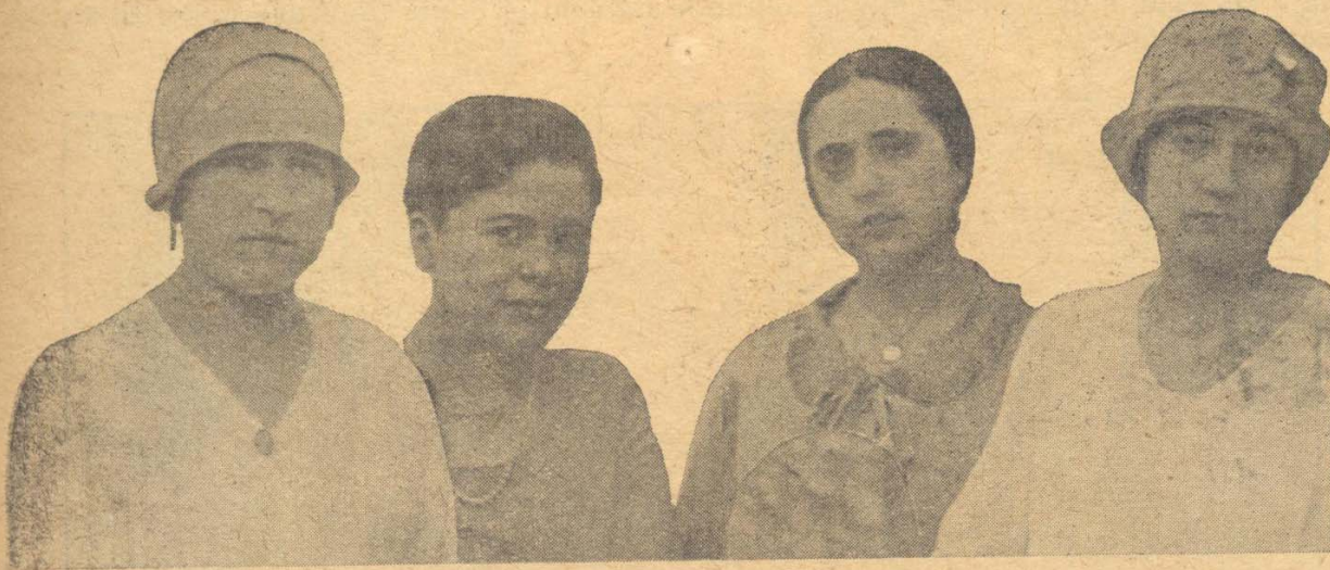
Señoritas que constituían la Corte de Honor de las Madrinas de las banderas